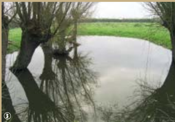
Une possible rencontre avec Marie-Groëtte...

Avez-vous peur des sorcières ? Oui... ! Alors pour vous aider à surmonter vos angoisses face à ces êtres terrifiants, voici le portrait d'un personnage de nos campagnes, qui a fait frissonner petits et grands, des berges de la Flandre à l'Artois... Vous verrez, quand vous la connaîtrez mieux, elle ne vous effraiera plus !