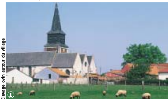
Elevage ovin autour du village