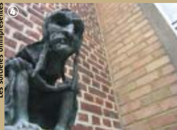
Les sorcières omniprésentes

Alors, toujours effrayé par les sorcières ?