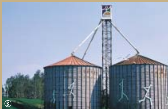
Mosaïc - Houplin-Ancoisne.

Le tout nouveau jardin Mosaïc entraîne les visiteurs à rêver d'une métropole verte et bleue, où les cultures des communautés installées dans la métropole lilloise, se mélangent pour le plus grand plaisir des amoureux de la nature.