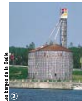
Les berges de la Deûle.

Prudence dans la traversée de la RD 63 ou des rues de centre ville. Respectez la réglementation des sites aménagés. Pour compléter le parcours, visitez Mosaïc (entrée payante). Ce parc, réalisé par des paysagistes et des artistes, représente à travers 7 jardins les communautés culturelles du Nord.