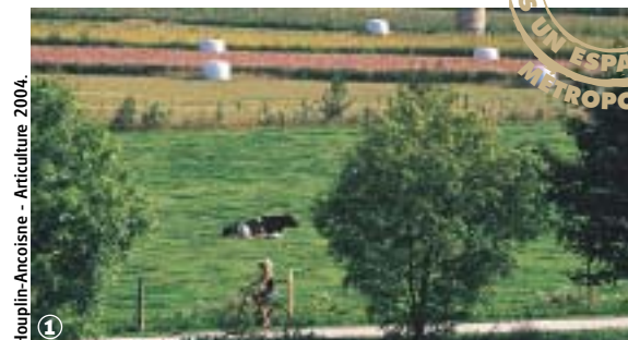
Houplin-Ancoisne - Articulture 2004.

Randonnée Pédestre Sentier de la Pouillerie : 8 km