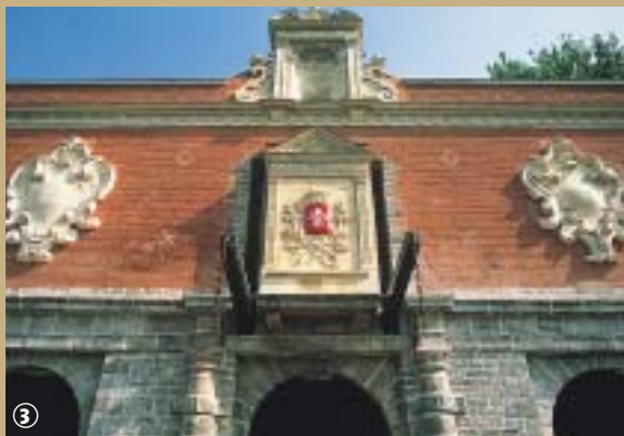
Porte de Gand

Saviez-vous que Lille est française depuis seulement 1667 ? Au gré des guerres, des héritages et des alliances, elle fut, tour à tour, flamande, bourguignonne et espagnole ! Construite sur les bords de la Deûle, cette cité drapière, devenue capitale des Ducs de Bourgogne, a accumulé, au fil de son histoire, un nombre considérable de richesses historiques et architecturales.