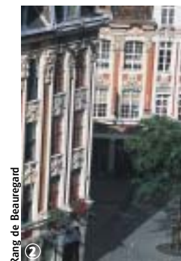
Rang de Beaugard