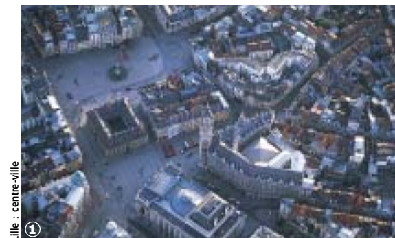
Lille : centre-ville