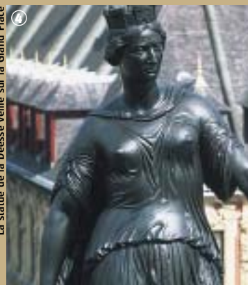
La statue de la Déesse veillant sur la Grand Place

Dans un tout autre style, et plus proche du centre ville, la place du Théâtre vous met nez à nez avec le large perron de l'Opéra, conçu par le célèbre architecte Louis Cordonnier et inauguré par Guillaume II en 1914. De style Louis XVI, le lieu est composé d'espaces exceptionnellement vastes répondant alors aux normes de sécurité de l'époque. Sa façade, ornée de bas-reliefs, s'harmonise parfaitement avec le « Rang de Beaugard » magnifique alignement de maisons du XVII e siècle, récemment restauré. Et si, en plus, la musique et la danse vous passionnent, l'Opéra sera votre lieu de rendez-vous avec des œuvres baroques ou contemporaines... à consommer sans modération comme tout le patrimoine du Vieux-Lille !