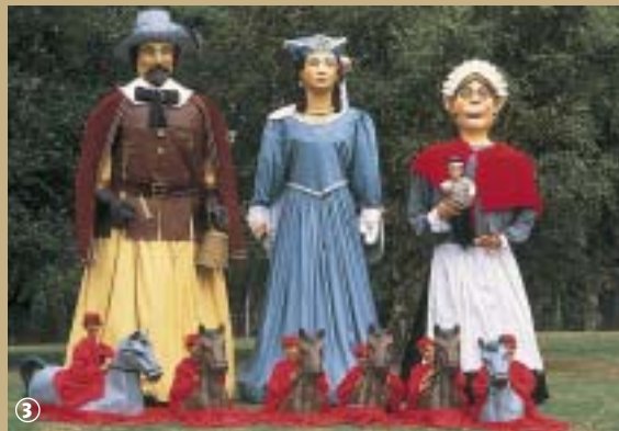
Les géants de Bourbourg

Bourbourg, encerclée par l'Aa canalisée qui suit le tracé des anciens remparts, est une ville séduisante aux yeux du voyageur. Vaste commune de la Flandre maritime, située dans le pays des waterings, elle est traversée par un canal reliant l'Aa à la mer du Nord.