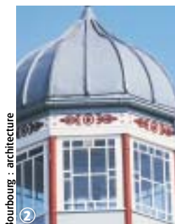
Bourbourg : architecture

En ville, cheminez le long des trottoirs et empruntez les passages protégés. Meilleure période de mars à octobre.