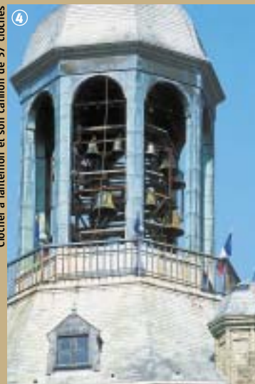
Clocher à lanternon et son carillon de 37 cloches

Alors, que ce soit pour son église, ses spécialités à la chicorée, ses géants ou simplement pour le charme de la ville, faites donc un petit tour du côté de Bourbourg !