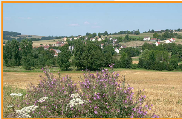
Une vue d'Essises. -S. Lefebvre-