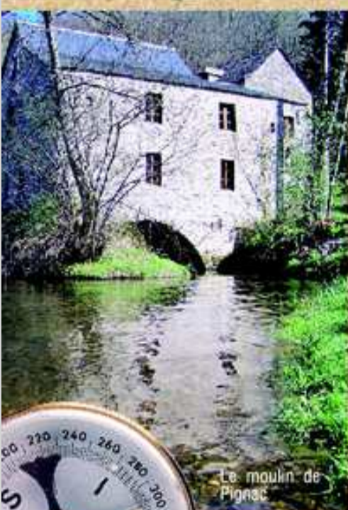
Le moulin de Pignac