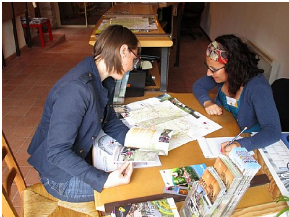
OT Ségala Tarnais

Contact : Téléphone : 05 63 76 76 67 05 63 43 46 44 Email : accueil@tourisme-tarn-carmaux.fr