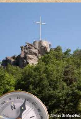
Calvaire de Mont-Roc