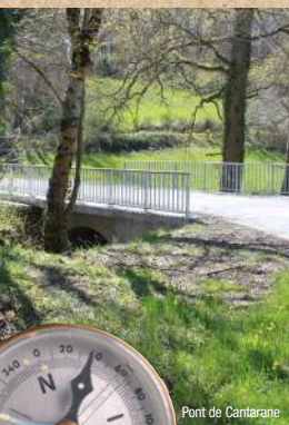
Pont de Cantarane