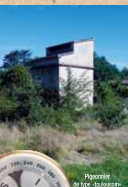
Pigeonnier de type «toulousain»