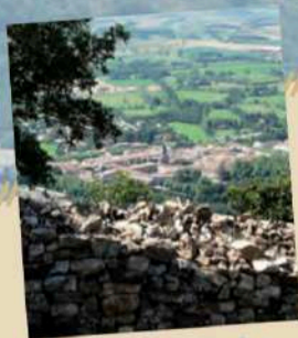
Sorèze depuis les feuilles de Berniquaut