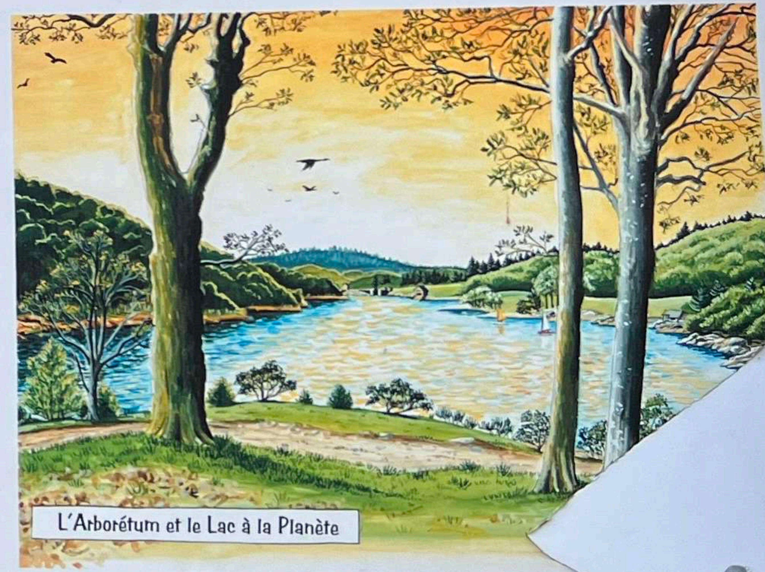
L'Arboretum et le Lac à la Planète

Éditeur de la cartographie LAURENT DESCAZAK LES JARDINIERS DU HAUT-LANGUEDOC