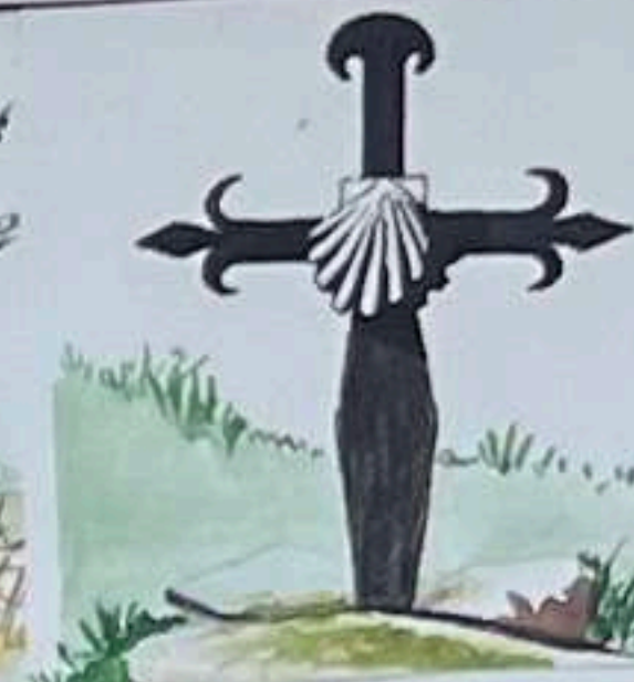
Croix sur le chemin des Pèlerins de St Jacques (Bouisset)