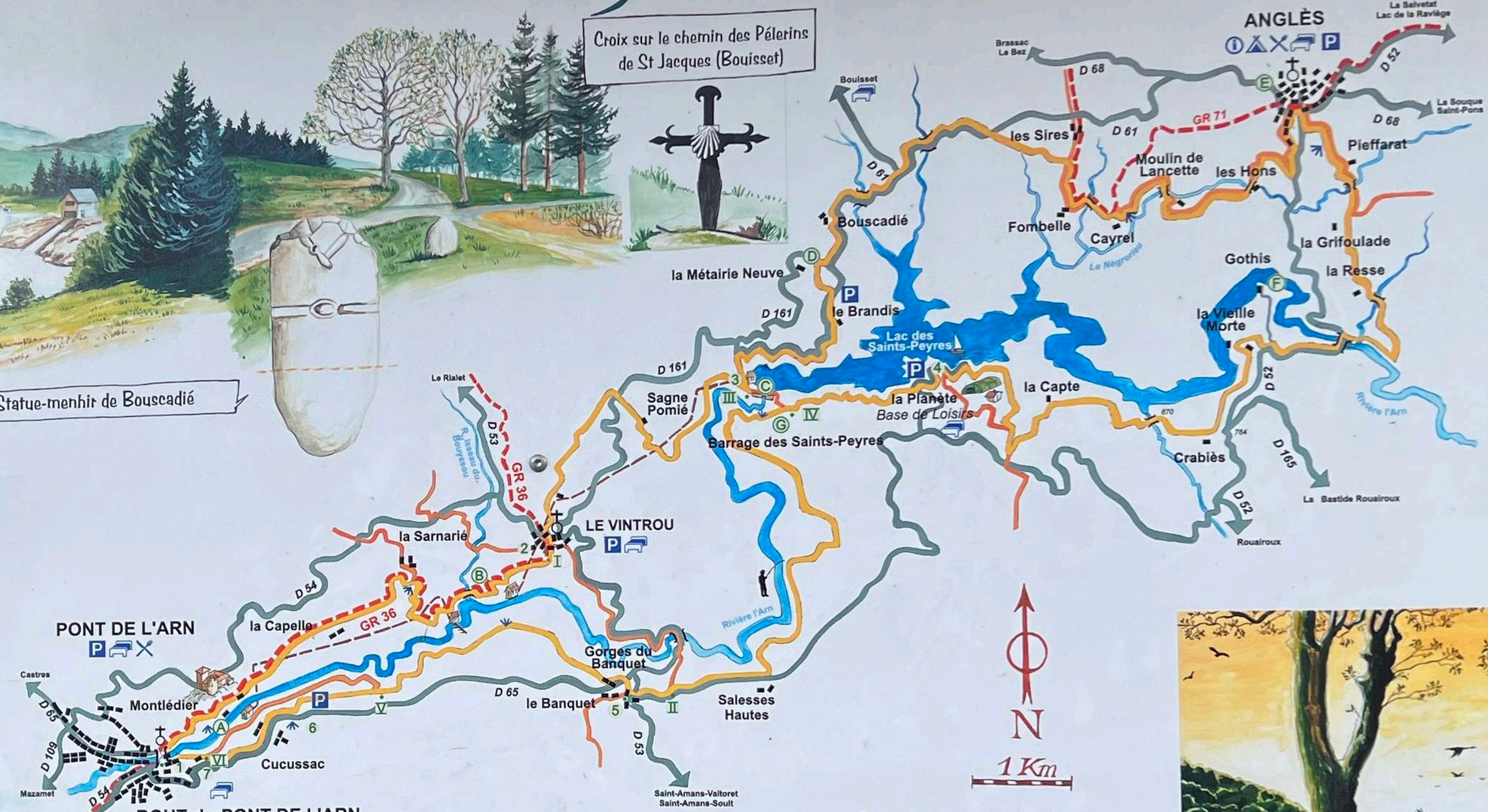
Les Gorges du Banquet