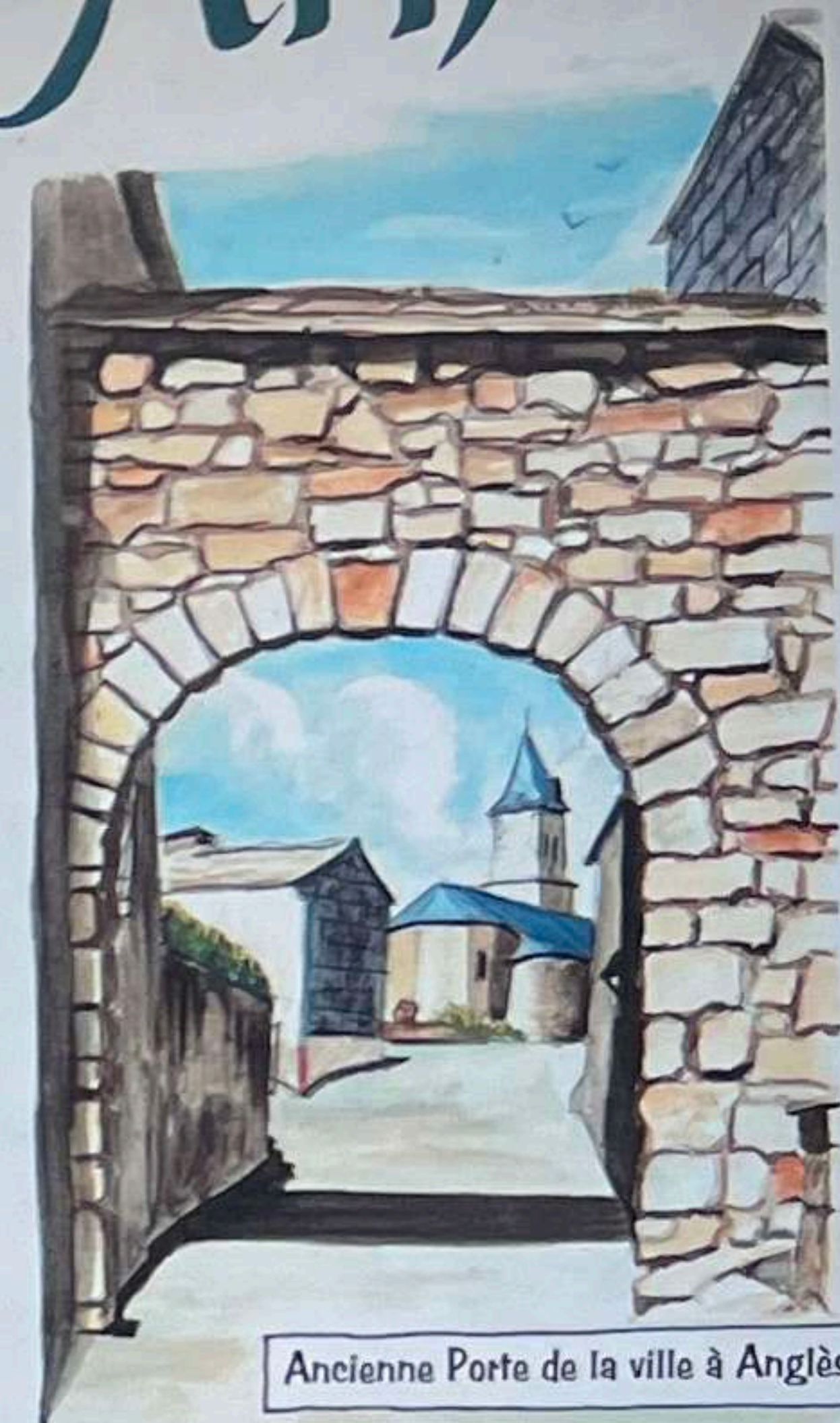
Ancienne Porte de la ville à Anglès