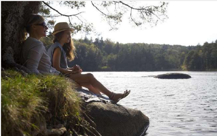
Départ du Lac du Merle (Luc Béziat)