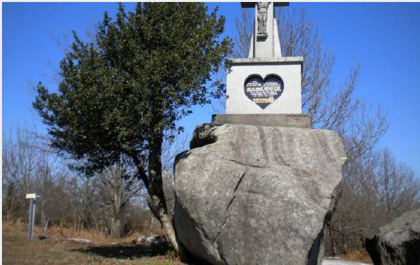
Croix sur le sentier de Veyrières